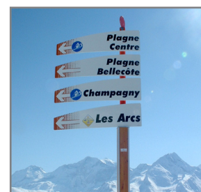
La Plagne (73)