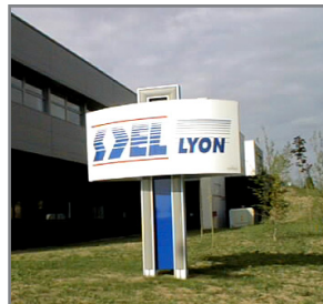
Société SDEL (69)