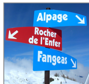
Serre Chevalier (05)