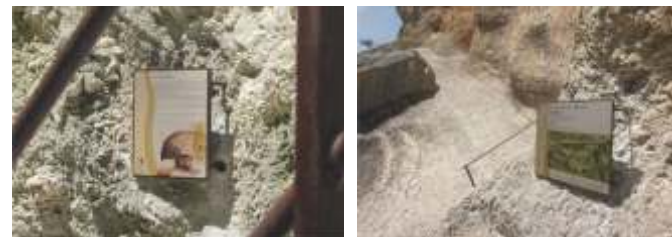
Sentier Blanc Martel

format standard de A6 à A1 ( sur demande : personnalisation des dimensions et possibilité d'ajouter un motif découpé ) visuel en impression numérique sur tôle aluminium avec application de vernis mat ou brillant anti UV, fixation au support par collage ( sur demande fixation par vis à tête bombée avec empreinte inviolable ) ( prestation graphique sur demande )