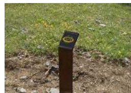
Jalonnement piéton sur le sentier de Péone