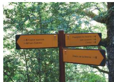
Sentier Blanc Martel

visuel en impression numérique sur tôle aluminium avec application de vernis mat ou brillant anti UV, (garantie 10 ans) fixation au support par collage ( sur demande fixation par vis à tête bombée avec empreinte inviolable )