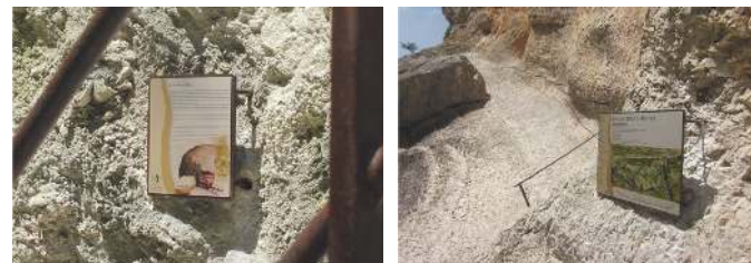
Sentier Blanc Martel