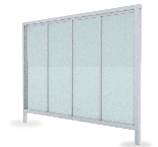
Réf : T Cloison Translucide -PMMA coulé incolore ou givré -plexi alvéolaire translucide -verre sécurit incolore 8mm *autres coloris sur demande