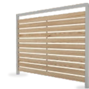
Réf : B Cloison Bois (lames de mélèze ajourées, Autres essences de bois sur demande)