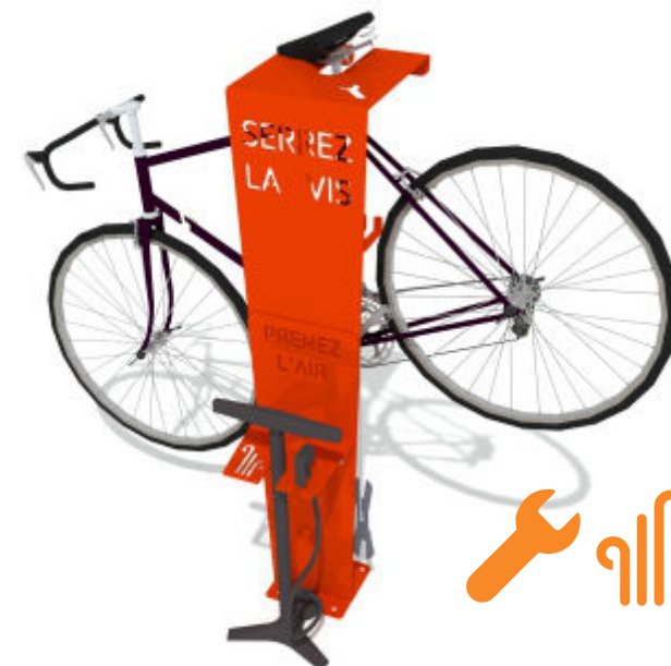
BORNE DE RÉPARATION ET GONFLAGE LUD-BRG