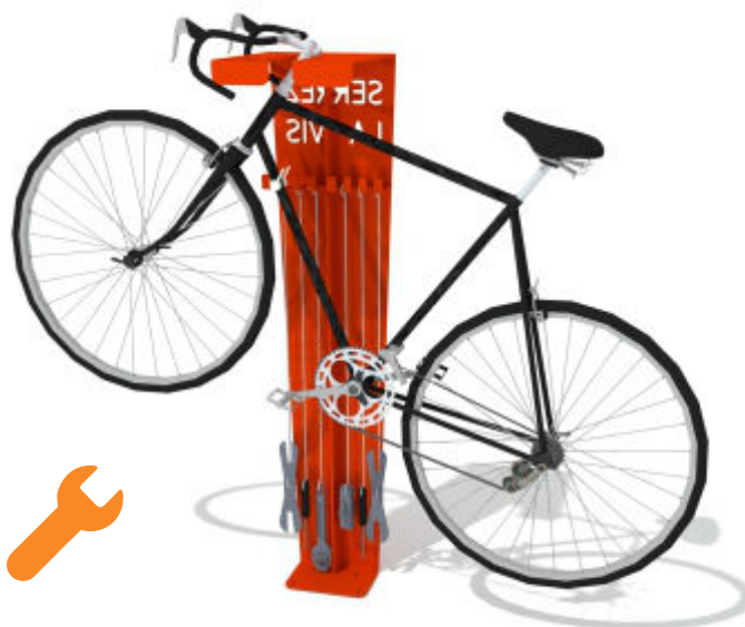
BORNE DE RÉPARATION LUD-BR