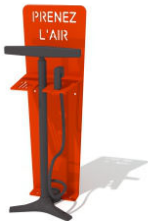
BORNE DE GONFLAGE LUD-BG