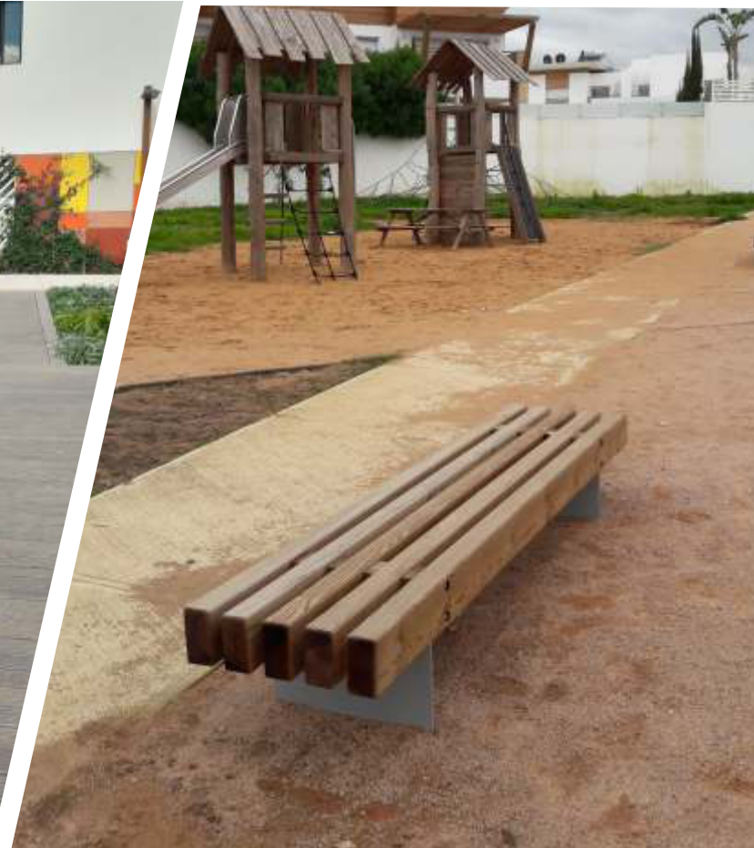
Banquette ref: CAT/BQ