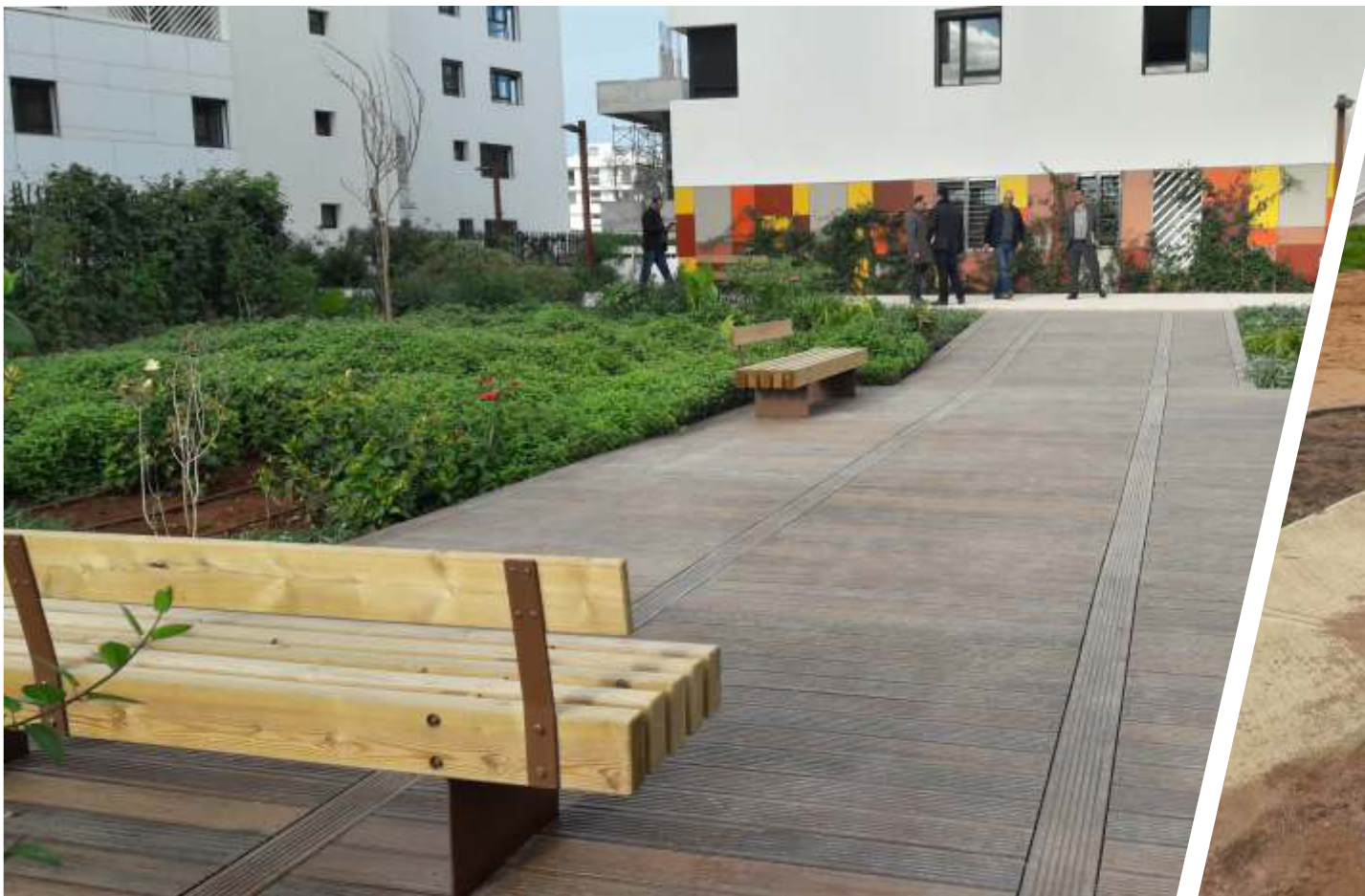
Banc ref: CAT/BA3