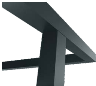
RAL 7016 gris foncé

Sur demande, autres coloris dans la gamme RAL.