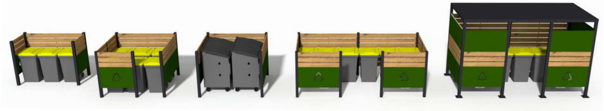
Réf 25°/ABP12-O (1 module 1x2m ouvert)