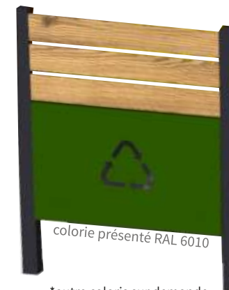
*autre coloris sur demande

Les cloisonnements opaques réalisent des espaces semi clos ou totalement fermés. Elles se composent de toles en acier thermolaqué RAL 9006* et logo en découpe laser** et d'un bandeau de lames aluminium sublimé aspect teck.