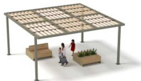
Ref. 25°/PERG120 - 6x6m - PERS Dimensions L 6,00 x l. 6,00 x h. 2,80m