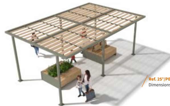
Ref. 25°/PERG80 - 6x4m - PERS Dimensions L 6,00 x l. 4,00 x h. 2,50m