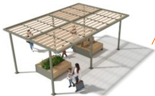
Ref. 25°/PERG80 - 6x4m - PERS Dimensions L 6,00 x l. 4,00 x h. 2,50m