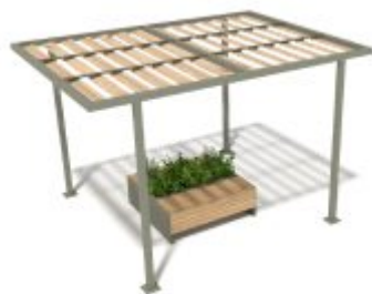
Ref. 25°/PERG80 - 4x3m - PERS Dimensions L 4,00 x l. 3,00 x h. 2,50m