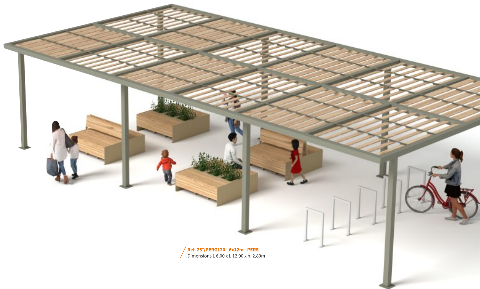
Ref. 25°/PERG120 - 6x12m - PERS Dimensions L 6,00 x l. 12,00 x h. 2,80m

Nos lignes sont adaptables à toutes les dimensions. Les pergolas urbaines 25°&Cie, aux lignes ingénieuses et élancées, permettront de s'abriter des rayons indésirables du soleil dans une ambiance des plus chaleureuses. Les pergolas urbaines sont déclinables selon les besoins et l'endroit souhaité. Elles permettent de créer un couloir ombragé pour la circulation piétonne, mais aussi un espace farniente sur une esplanade.