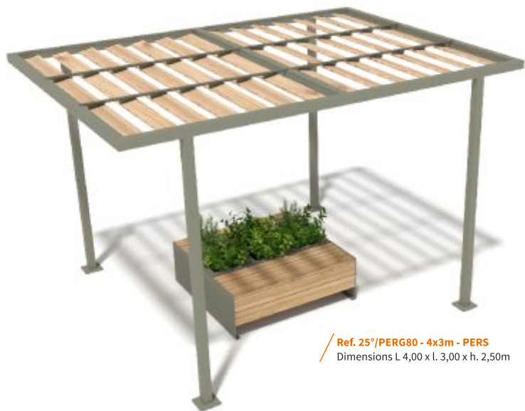
Ref. 25°/PERG80 - 4x3m - PERS Dimensions L 4,00 x l. 3,00 x h. 2,50m