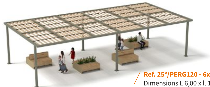
Ref. 25°/PERG120 - 6x12m - PERS Dimensions L 6,00 x l. 12,00 x h. 2,80m